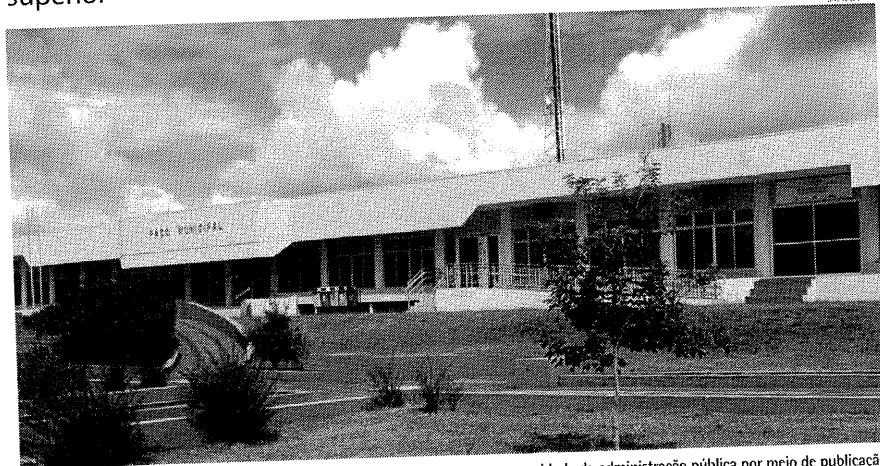
A quantidade de vagas que poderão ser ofertadas serão abertas conforme a necessidade da administração pública por meio de publicação oficial

d) do ensino superior, para os cursos de administração, agronomia, análise e desenvolvimento de sistemas, arquitetura e urbanismo, arte-educação, ciências bio-